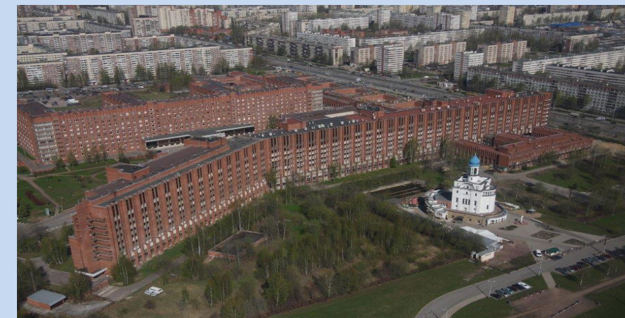
✓ ГБУЗ ЛОКБ