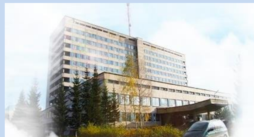
✓ ГБУЗ ЛО «Тихвинская МБ»