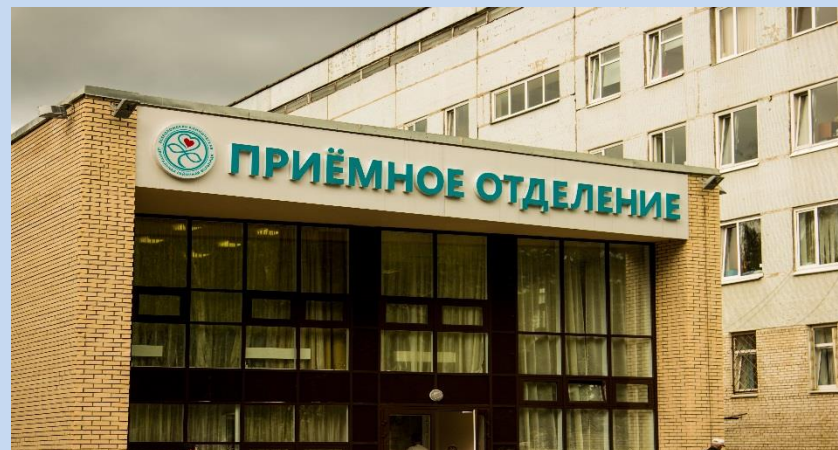
✓ ГБУЗ ЛО «Всеволожская КМБ»