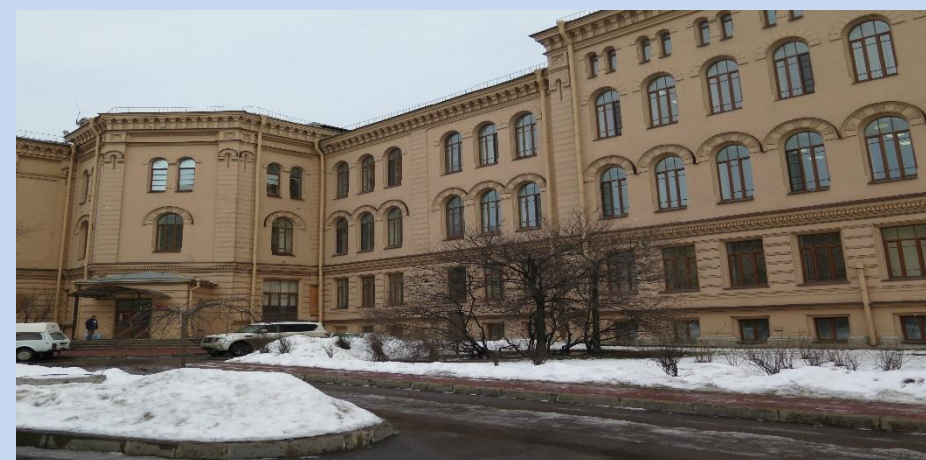
✓ ГБУЗ ЛО ДКБ