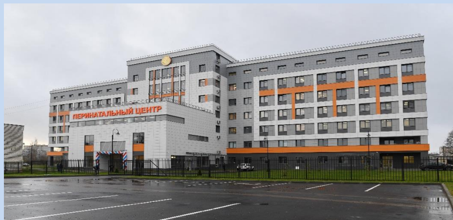
✓ ГБУЗ ЛО «Гатчинская КМБ» (Перинатальный центр)

Выбор медицинской организации по профилю