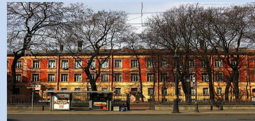
✓ ГБУЗ ЛОКОД